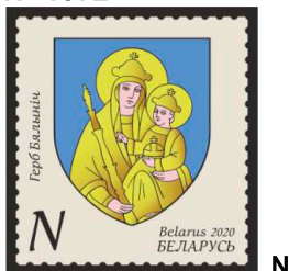
Герб Бялыніч (Герб Бялыніч)